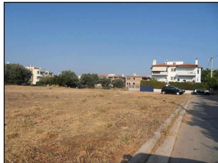
09. ΑΠΟ ΕΥΡΙΔΙΚΗΣ 1 ΠΡΟΣ ΕΥΡΙΔΙΚΗΣ 2