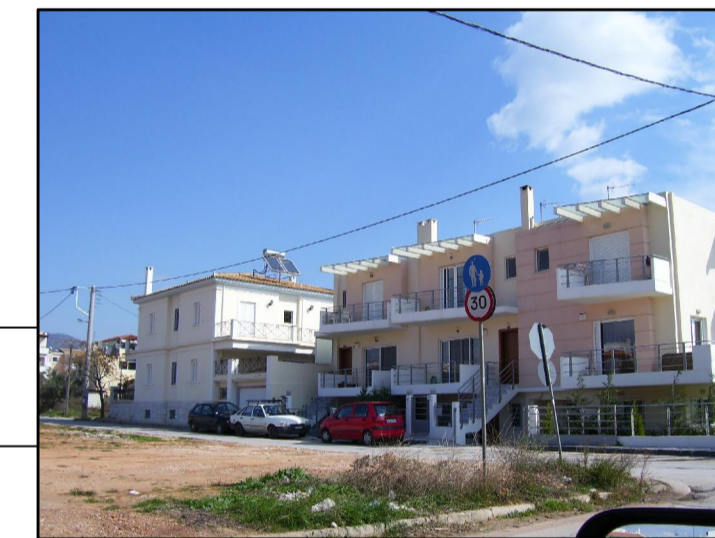
02. ΑΠΟ ΓΕΝΝΗΜΑΤΑ ΠΡΟΣ ΚΛΕΙΣΟΥΡΑΣ