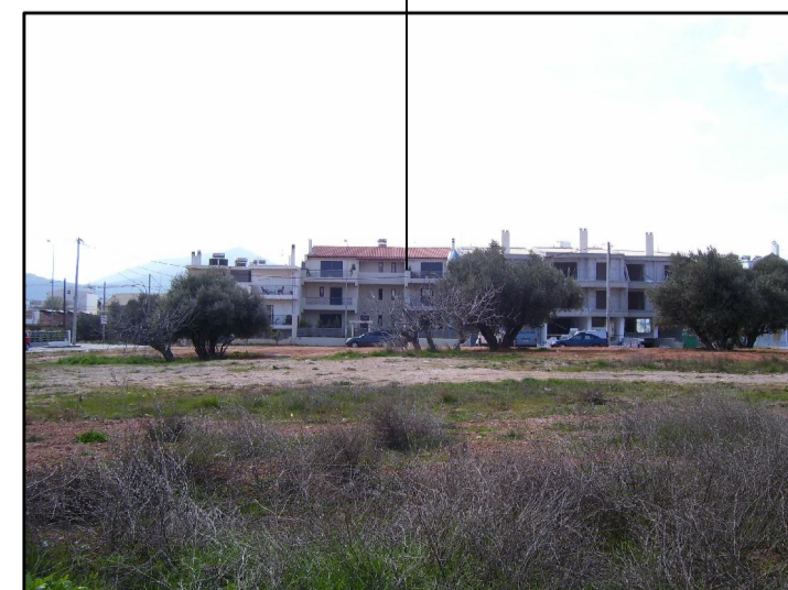
14. ΑΠΟ ΕΥΡΙΔΙΚΗΣ 1 ΠΡΟΣ ΓΕΝΝΗΜΑΤΑ