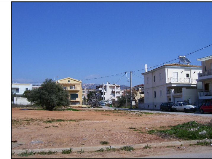
04. ΑΠΟ ΓΕΝΝΗΜΑΤΑ ΠΡΟΣ ΚΛΕΙΣΟΥΡΑΣ- ΕΥΡΙΔ. 1