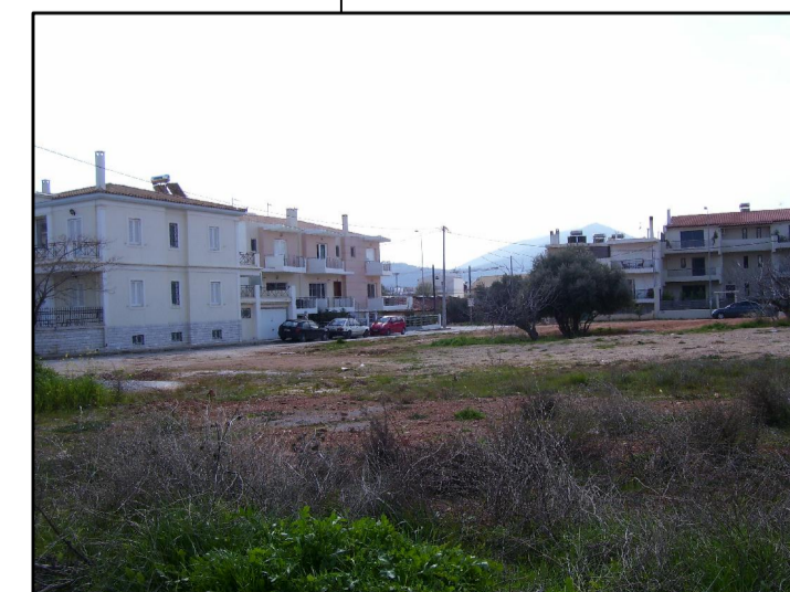
15. ΑΠΟ ΕΥΡΙΔΙΚΗΣ 2 ΠΡΟΣ ΚΛΕΙΣΟΥΡΑΣ- ΓΕΝ.