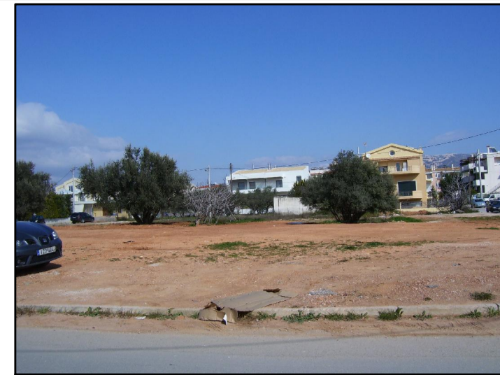
06. ΑΠΟ ΓΕΝΝΗΜΑΤΑ ΠΡΟΣ ΕΥΡΙΔΙΚΗΣ 1