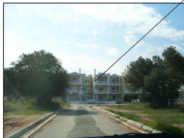
12. ΑΠΟ ΕΥΡΙΔΙΚΗΣ 2 ΠΡΟΣ ΓΕΝΝΗΜΑΤΑ