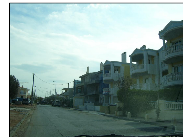
16. ΑΠΟ ΓΕΝΝΗΜΑΤΑ ΠΡΟΣ ΚΛΕΙΣΟΥΡΑΣ- ΓΕΝΝΗΜ.

ΕΛΛΗΝΙΚΗ ΔΗΜΟΚΡΑΤΙΑ ΝΟΜΟΣ ΑΤΤΙΚΗΣ ΔΗΜΟΣ ΧΑΛΑΝΔΡΙΟΥ ΤΕΧΝΙΚΗ ΥΠΗΡΕΣΙΑ