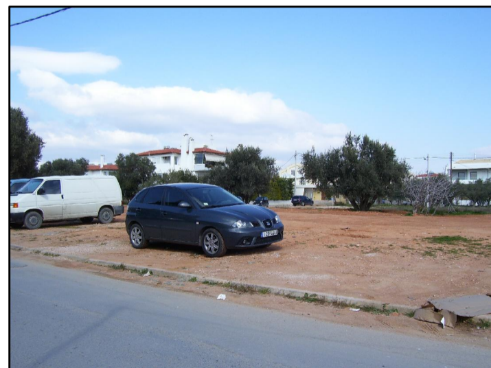
11. ΑΠΟ ΓΕΝΝΗΜΑΤΑ ΠΡΟΣ ΕΥΡΙΔΙΚΗΣ 2