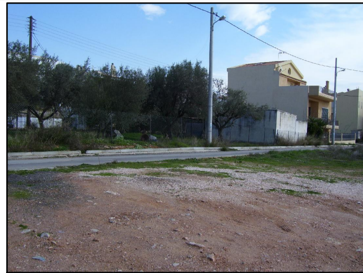
07. ΑΠΟ ΕΥΡΙΔΙΚΗΣ 2 ΠΡΟΣ ΕΥΡΙΔΙΚΗΣ 1