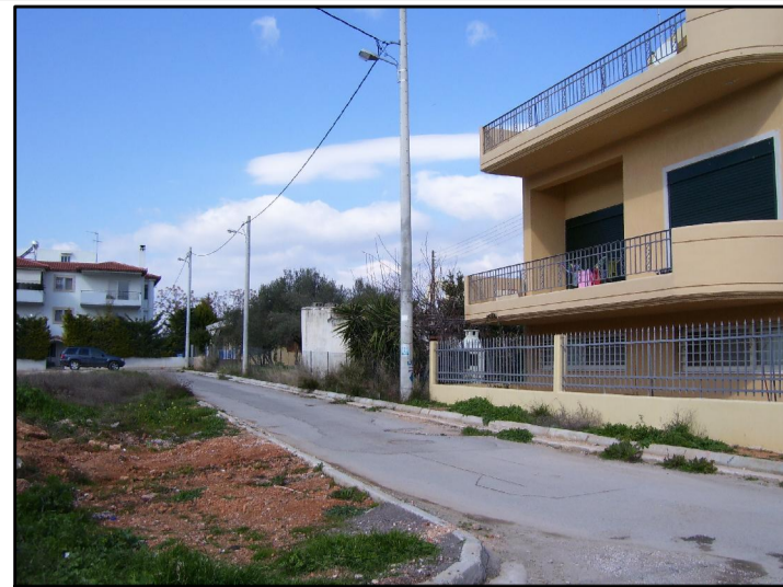
08. ΑΠΟ ΕΥΡΙΔΙΚΗΣ 1 ΠΡΟΣ ΕΥΡΙΔΙΚΗΣ 2