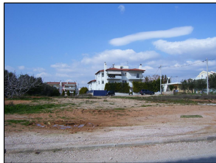
10. ΑΠΟ ΚΛΕΙΣΟΥΡΑΣ ΠΡΟΣ ΕΥΡΙΔΙΚΗΣ 2