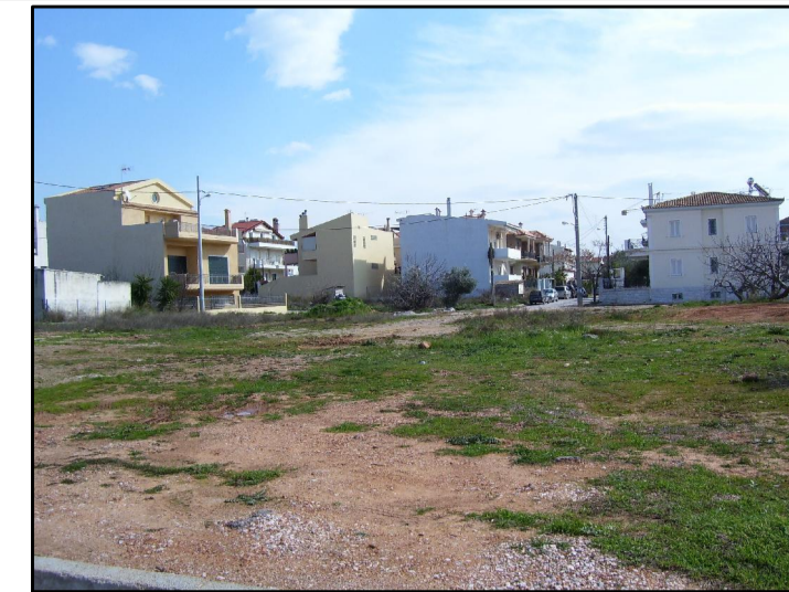
05. ΑΠΟ ΕΥΡΙΔΙΚΗΣ 2 ΠΡΟΣ ΕΥΡΙΔΙΚΗΣ 1- ΚΛΕΙΣ.