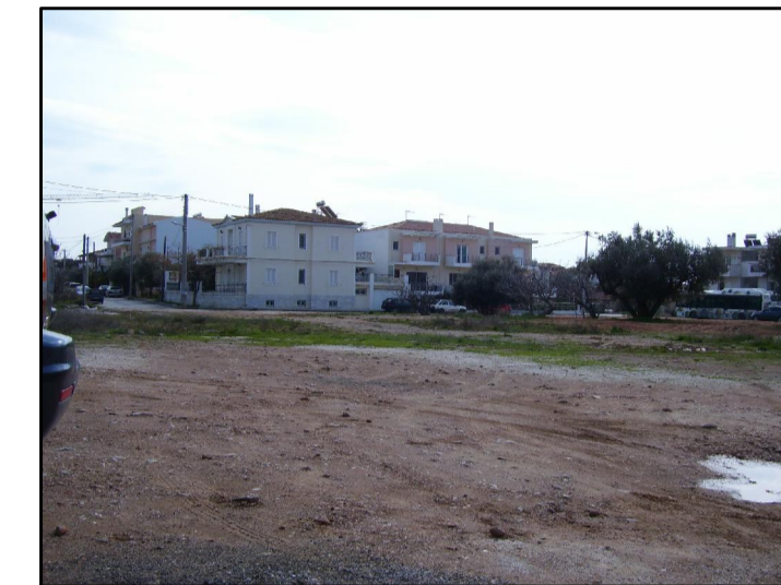
03. ΑΠΟ ΕΥΡΙΔΙΚΗΣ 2 ΠΡΟΣ ΚΛΕΙΣΟΥΡΑΣ