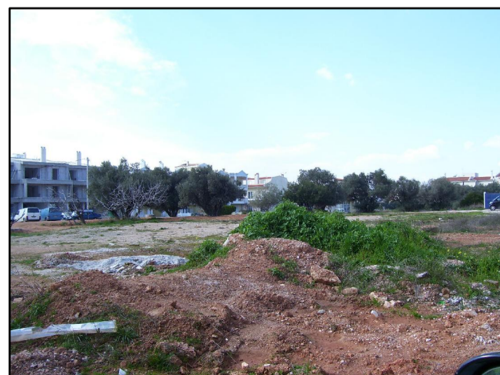
13. ΑΠΟ ΕΥΡΙΔΙΚΗΣ 1 ΠΡΟΣ ΓΕΝΝΗΜΑΤΑ