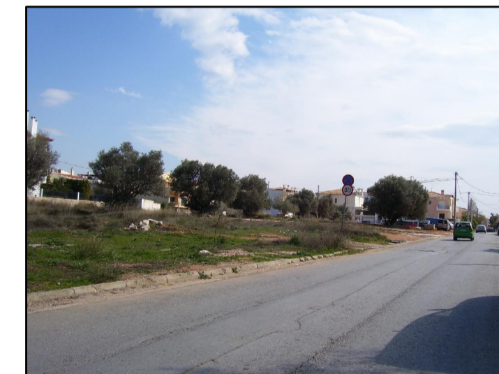
01. ΑΠΟ ΓΕΝΝΗΜΑΤΑ ΠΡΟΣ ΚΛΕΙΣΟΥΡΑΣ